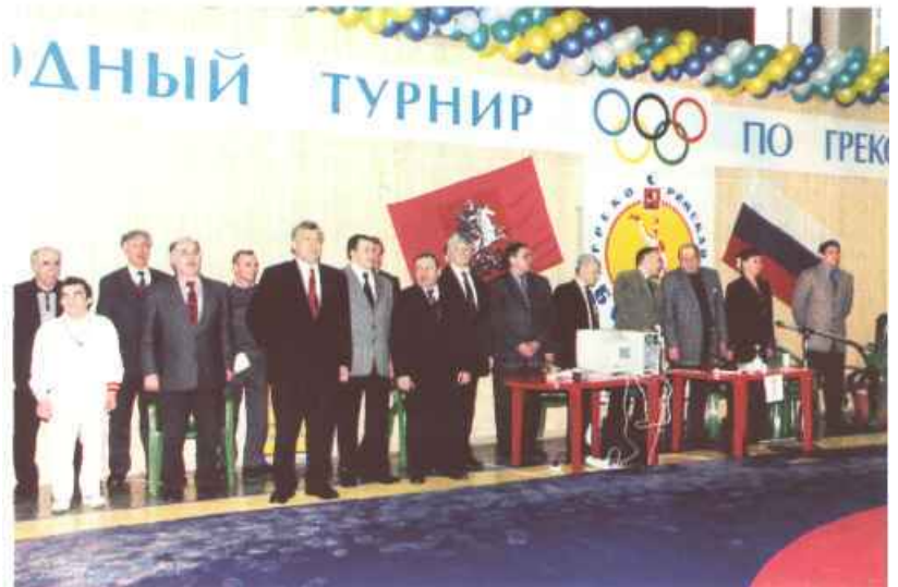
На соревнования с удовольствием приходят известные люди столицы