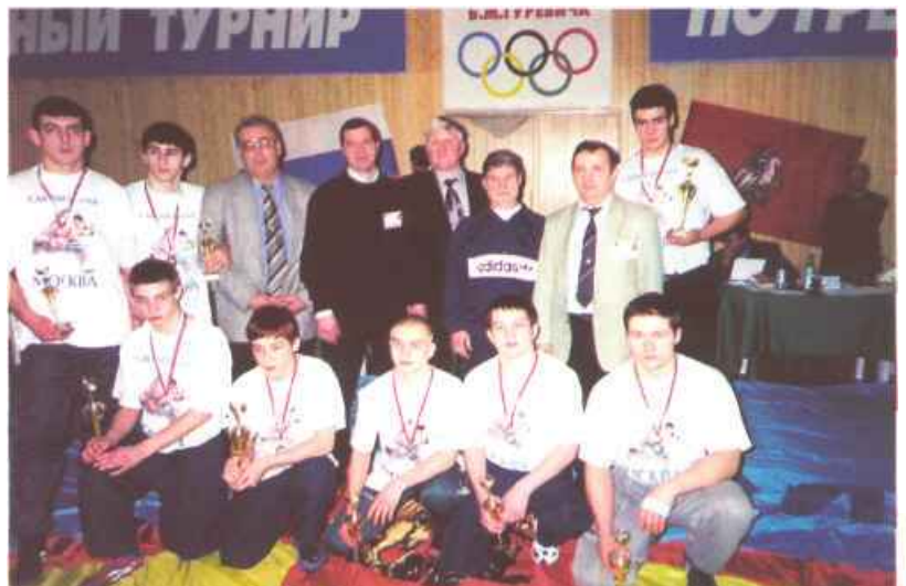
Борцы и тренеры Московской спортшколы олимпийского резерва №64