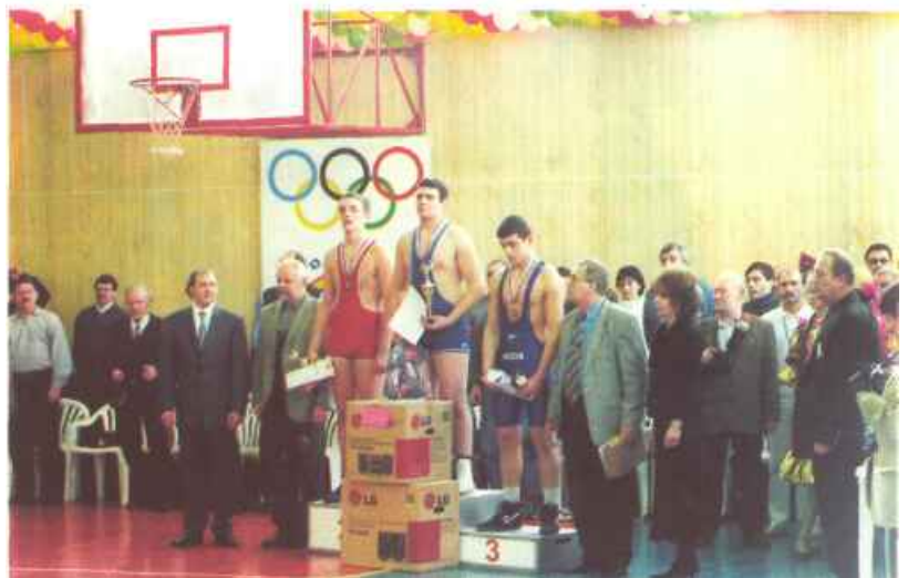
Победители и призеры турнира традиционно получают отличные подарки