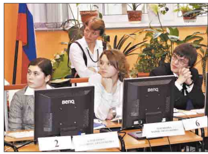
■ А что бы ты сделал на месте главы управы?